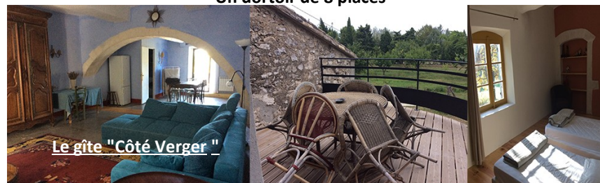
Le gîte "Côté Verger"

Deux gîtes de 5 à 7 personnes. Chacun avec cuisine équipée et sanitaires. Un dortoir de 8 places