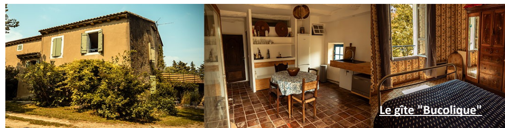
Le gîte "Bucolique"